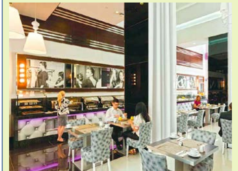
Frühstück in stilvollem Ambiente