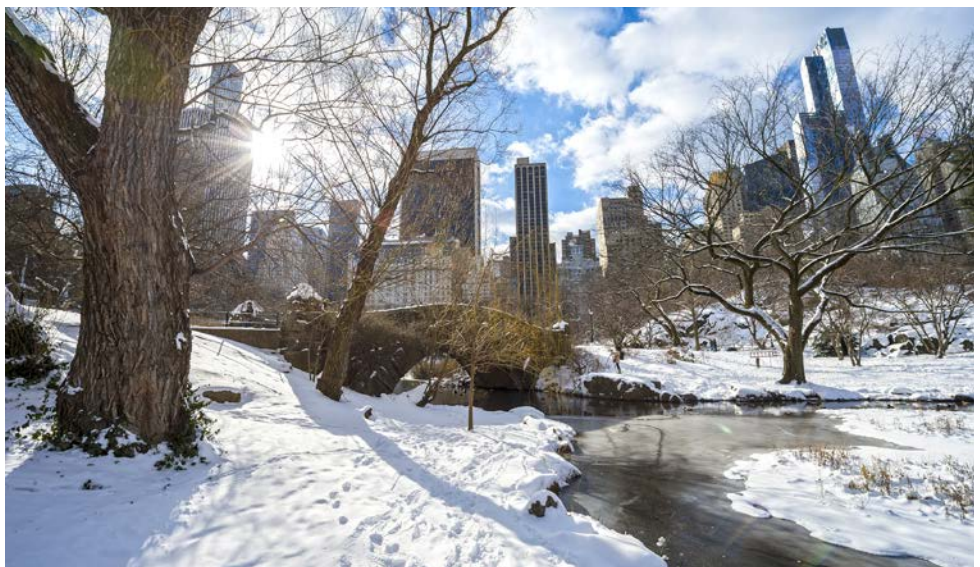
Central Park im Winter

werden Sie vom Gegenteil überzeugen: Am frühen Morgen reisen Sie mit dem Direktzug von der Penn Station in New York in gut 3 Stunden komfortabel nach Washington. Dort treffen Sie um ca. 11 Uhr an der Union Station, einem der imposantesten Bahnhöfe der Welt, ein. Ein guter Bekannter Ihrer Reiseleitung erwartet Sie inmitten der riesengroßen Bahnhofshalle, direkt unter der nicht minder imposanten Bahnhofsuhr zu einem Spaziergang durch die US-Hauptstadt. Zu Fuß entdecken Sie alle wesentlichen Sehenswürdigkeiten auf der weltbekannten Mall zwischen US-Capitol und Lincoln Memorial. Danach starten Sie dem Weißen Haus einen Besuch ab. Im nahen Georgetown lassen Sie es sich dann vor der Heimreise nach New York kulinarisch richtig gut gehen und genießen ein frühes Abendessen (fakultativ). Gegen 19 Uhr Rückfahrt mit AMTRAK nach New York, wo Sie gegen 22:30 Uhr wieder ankommen. Wichtiger Hinweis: Dieser Ausflug muss bis spätestens 30 Tage vor Reiseantritt gebucht werden. Mindestteilnehmerzahl: 10 Personen, maximal 16 Personen!