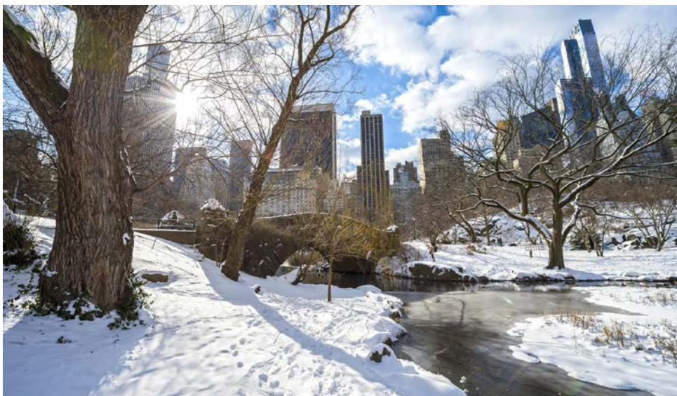
Central Park im Winter

werden Sie vom Gegenteil überzeugen: Am frühen Morgen reisen Sie mit dem Direktzug von der Penn Station in New York in gut 3 Stunden komfortabel nach Washington. Dort treffen Sie um ca. 11 Uhr an der Union Station, einem der imposantesten Bahnhöfe der Welt, ein. Ein guter Bekannter Ihrer Reiseleitung erwartet Sie inmitten der riesengroßen Bahnhofshalle, direkt unter der nicht minder imposanten Bahnhofsuhr zu einem Spaziergang durch die US-Hauptstadt. Zu Fuß entdecken Sie alle wesentlichen Sehenswürdigkeiten auf der weltbekannten Mall zwischen US-Capitol und Lincoln Memorial. Danach starten Sie dem Weißen Haus einen Besuch ab. Im nahen Georgetown lassen Sie es sich dann vor der Heimreise nach New York kulinarisch richtig gut gehen und genießen ein frühes Abendessen (fakultativ). Gegen 19 Uhr Rückfahrt mit AMTRAK nach New York, wo Sie gegen 22:30 Uhr wieder ankommen. Wichtiger Hinweis: Dieser Ausflug muss bis spätestens 30 Tage vor Reiseantritt gebucht werden. Mindestteilnehmerzahl: 10 Personen, maximal 16 Personen!